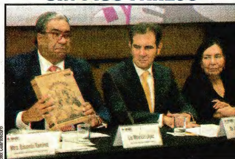
Lorenzo Córdova, presidente del INE. "Una pena que el Tribunal haya revocado la ley que prohíbe la promoción personal".