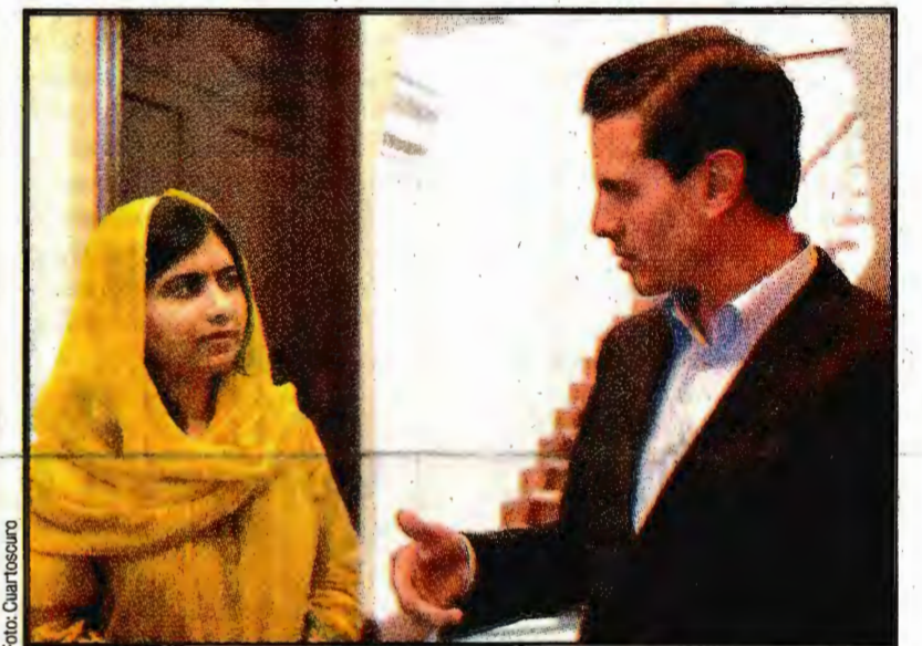
Enrique Peña Nieto se entrevistó con Malala Yousafzai, premio Nobel de la Paz, en Los Pinos. Dialogaron sobre la situación mundial de los derechos de los niños y su educación.