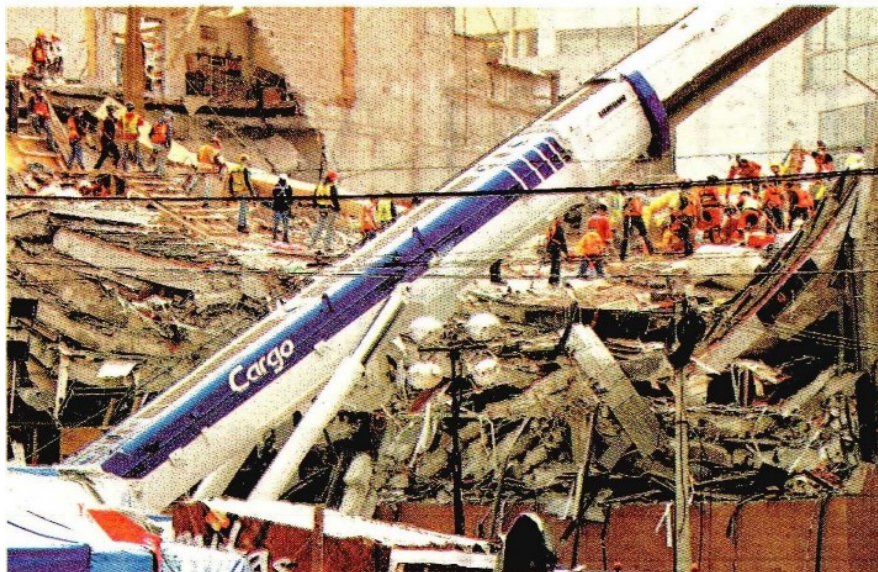
El tema central de la elección será la reconstrucción de las zonas afectadas.