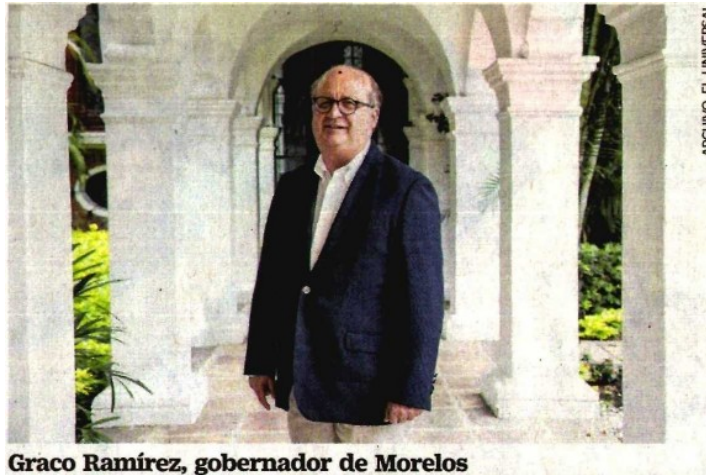
Graco Ramírez, gobernador de Morelos

Sus operadores y hasta el propio gobernador de Morelos se han quejado de la cobertura periodística por el manejo errático de la administración estatal de las aportaciones de la sociedad civil a los damnificados por el terremoto del 19-S. Graco Ramírez ha negado una y otra vez que acaparó la ayuda con fines políticos. Pero en una visita a Tlayacapan pobladores dieron muestras del rechazo hacia el mandatario del estado: "Fuera Graco, fuera Graco", "lárgate, haz tu trabajo", "suelta la ayuda", "¿dónde está la ayuda?". En medio de insultos, Ramírez destacaba que en siete días de contingencia era la segunda vez que el presidente Enrique Peña Nieto visitaba la entidad. En contraste, el jefe del Ejecutivo federal salió bien librado de suelo morelense. El problema, nos comentan, es que una parte de la población de Morelos está enardecida con sus autoridades, y el primer círculo de don Graco no se quiere percatar de la situación.