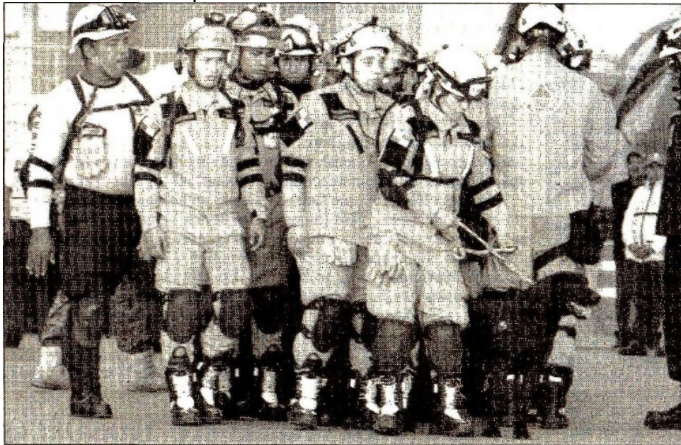
Rescatistas hondureños que participaron en labores de búsqueda de sobrevivientes del sismo, al ser despedidos en el hangar de la Policía Federal

Fax: 5605-2099 • juliohdz@jornada.com.mx • Twitter: @julioastillero • Facebook: Julio Hernández