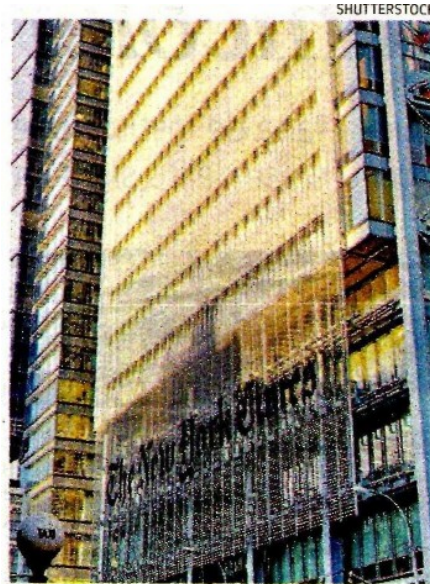
Sede de The New York Times en EU.