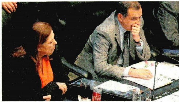
Graciela Ortiz y Ernesto Cordero, ayer en el Senado

ministros de la Suprema Corte de Justicia de la Nación, quienes validaron a los que veían con condiciones para formar parte del tribunal electoral. Nos hacen ver que con esa intentona, se verifica que buscaba escalar puestos más que dedicarse al 100% a la fiscalía electoral, hoy acéfala.