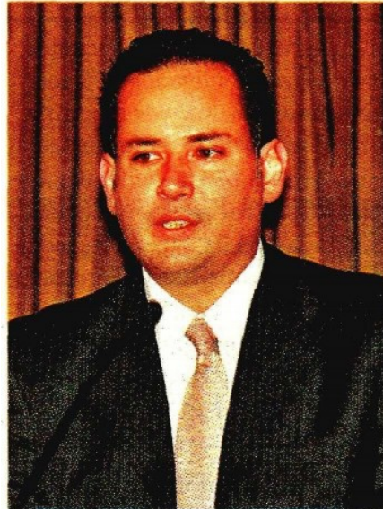
Santiago Nieto, ex titular de la Fepade.