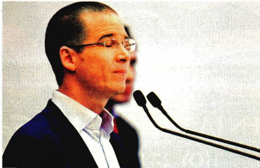
El dirigente de Acción Nacional, Ricardo Anaya.