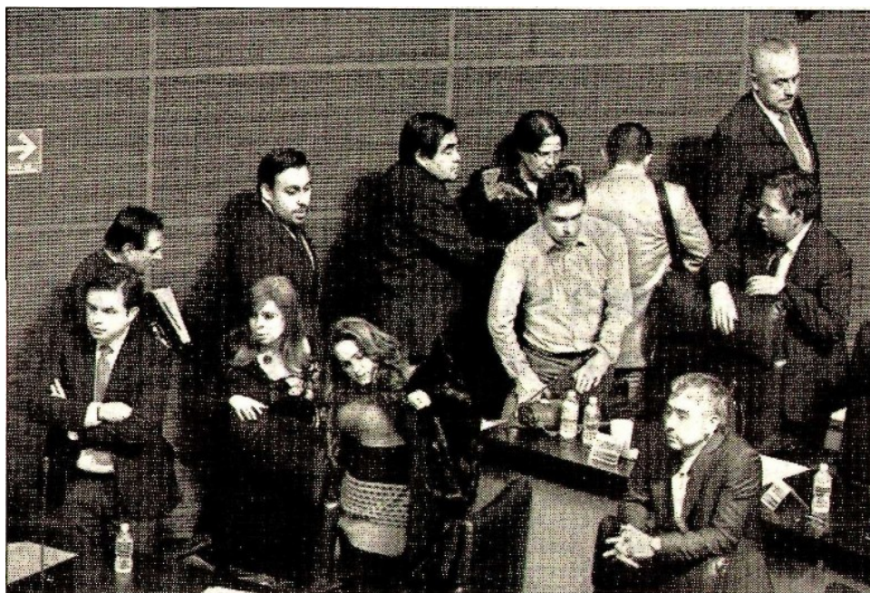
Las bancadas de PRD y PT se retiraron del salón de plenos del Senado, con el argumento de que no existían condiciones para continuar el debate sobre la reforma a la Ley Federal de Telecomunicaciones y Radiodifusión

Fax: 5605-2099 • juliohdz@jornada.com.mx • Twitter: @julioastillero • Facebook: Julio Hernández