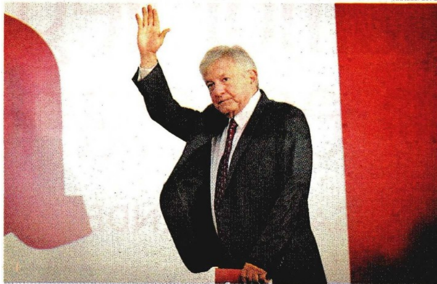
El líder de Morena.