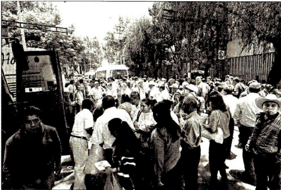
Integrantes de la Unión de Comuneros, Colonos y Ejidatarios de México mantienen un plantón en las inmediaciones de la Sagarpa, para exigir el impulso de políticas públicas que permitan al país un desarrollo sustentable

Fax: 5605-2099 • Twitter: @julioastillero • Facebook: Julio Astillero • juliohdz@jornada.com.mx