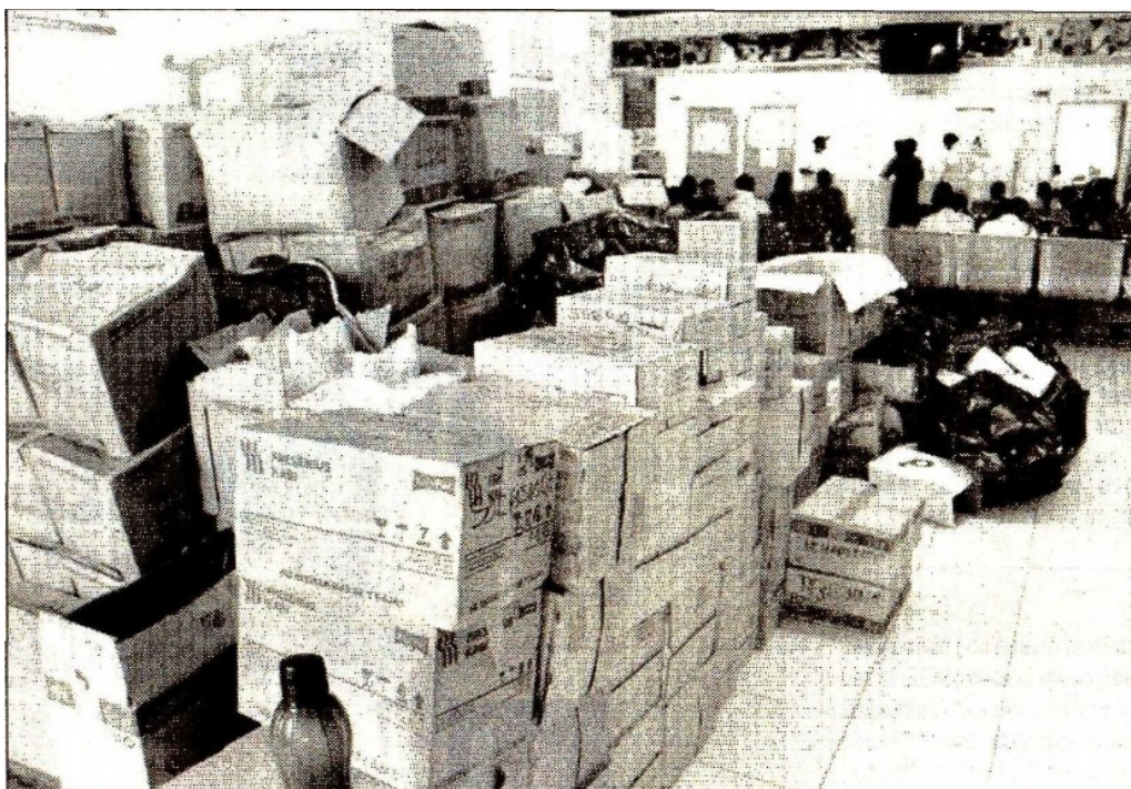
Cajas llenas de medicamentos donados por la sociedad civil se encuentran apiladas en la sala de espera del Hospital General Adolfo Becerril del municipio de Tetecala, Morelos, los cuales no han sido repartidos entre los damnificados por el sismo de magnitud 7.1 ocurrido el 19 de septiembre, en esa localidad y en demarcaciones vecinas ■ Foto Rubicela Morelos

Fax: 5605-2099 • Twitter: @julioastillero • Facebook: Julio Astillero • juliohdz@jornada.com.mx