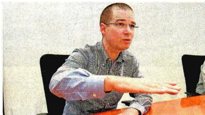
Ricardo Anaya, líder nacional del PAN

Y a propósito del PAN, nos hacen ver que, en uso de los tiempos del Estado que le corresponden, el panismo comenzó a difundir promocionales de la Cruz Roja Mexicana, con un llamado a realizar donativos en pro de los damnificados de los sismos. Con tu ayuda ya van 250 mil beneficiados, se indica en los promos, en los que aparece personal de la Cruz Roja y del Ejército Mexicano en labores de apoyo a los afectados. Estos spots suman a la causa, amén de la cuenta bancaria con 50 millones de pesos abierta en beneficio de los afectados. Algunos panistas aseguran que sólo un terremoto pudo lograr que el presidente del partido, Ricardo Anaya , se bajara de los spots de televisión, que por meses mantuvo acaparados para su promoción personal.