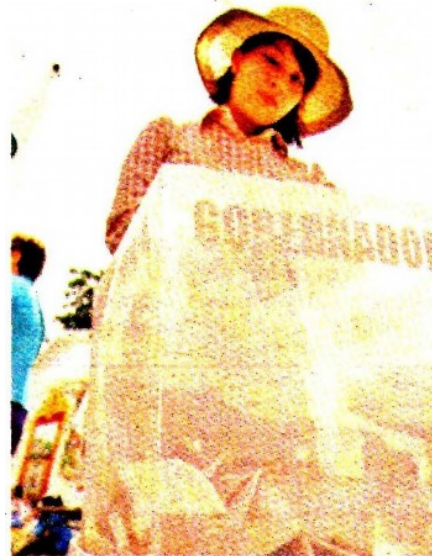
La elección del Estado de México, ejemplar.