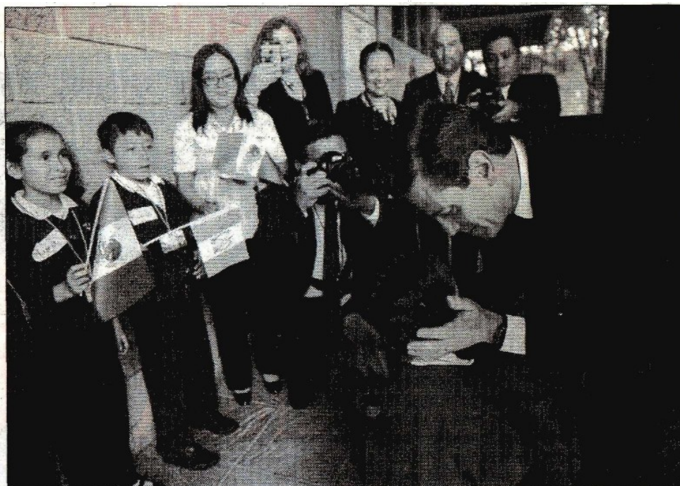
En el contexto de su visita a Guatemala, el presidente Enrique Peña Nieto visitó el Centro Educativo Rotario Benito Juárez, que forma parte del Programa Escuelas México, mediante el cual se apoya a 20 planteles del país sudamericano

Fax: 5605-2099 • juliohdz@jornada.com.mx • Twitter: @julioastillero • Facebook: Julio Hernández