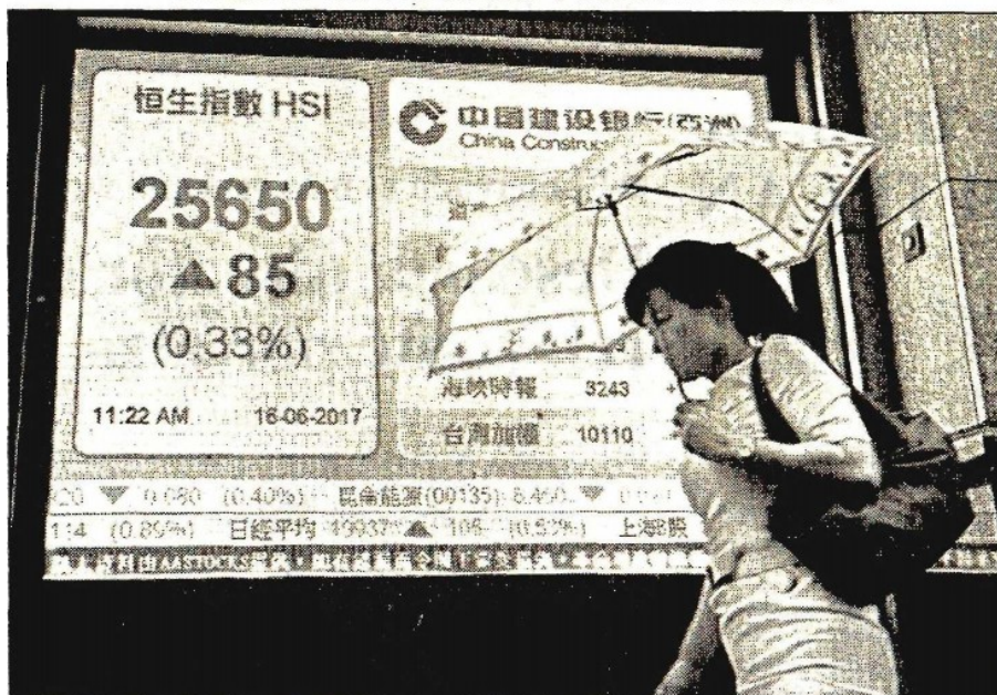
Las acciones de la bolsa de Nueva York cerraron el martes en baja, por caída de los precios del petróleo que golpeó al sector energético y descenso de los valores minoristas relacionado con el plan de Amazon.com de reforzar su negocio de vestimenta. El mercado profundizó sus pérdidas cerca del cierre, luego de que el presidente de la Reserva Federal de Dallas dijo que la tecnología y la globalización están frenando la inflación en Estados Unidos, lo que se sumó al descontento de los inversionistas por el ajuste de política monetaria. El Dow Jones perdió 0.29 por ciento a 21 mil 467.14 puntos, el Standard & Poor's cayó 0.66 por ciento a 2 mil 437.03 puntos y el Nasdaq Composite perdió 0.82 por ciento a 6 mil 188.03 puntos. La Bolsa Mexicana de Valores también cerró a la baja con 0.28 por ciento menos a 49 mil 33.05 unidades. (Reuters y de la Redacción). Un tablero electrónico de un banco muestra el índice Hang Seng en Hong Kong

cfvmexico_sa@hotmail.com • Twitter: @cafevega