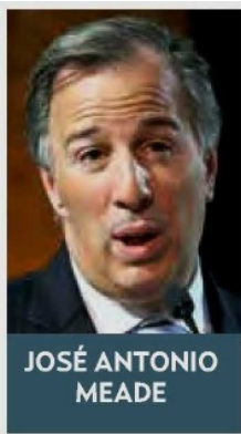
JOSÉ ANTONIO MEADE

De sus estrellas el Dabex para diabetes, Eutirox para la tiroides, Concor para hipertensión, Rebil para esclerosis múltiple, el antibiótico Denvar y no hace mucho logró el registro de Bavencio para metástasis de difícil control.