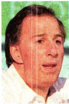
José Antonio Meade

¡wow! Doña Alicia también llamó la atención de que se lleva a cabo una desregulación silenciosa en Estados Unidos, y tendrá efectos en materia financiera y ambiental. "Si vemos las noticias, todos se están concentrando en lo que está pasando con el presidente ( Donald Trump ) y su familia, y en paralelo hay un proceso de desregulación silenciosa", advirtió.