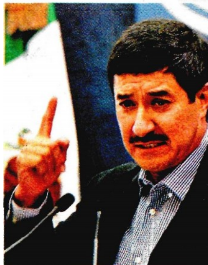
Javier Corral, gobernador de Chihuahua.