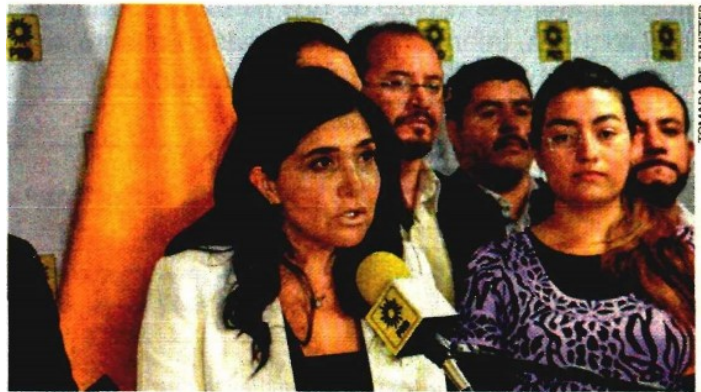
La dirigente nacional del PRD, Alejandra Barrales