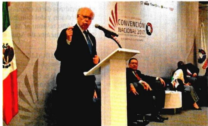
El secretario de Salud, José Narro

Apapachadísimo se le vio al secretario de Salud, José Narro Robles , en el guateque con motivo del cumpleaños del ex candidato presidencial panista Diego Fernández de Cevallos , quien año con año recibe en su rancho de Querétaro a personalidades de la política y la sociálité . Luego de la placeada que le han dado recientemente a don Pepe , a quien presentan como una posible carta del PRI para 2018, el también ex rector de la UNAM se dejó querer, nos cuentan. En la comida, nos dicen, estuvieron entre los 800 invitados el ex presidente Carlos Salinas de Gortari y el empresario Carlos Slim . Hace un año, la ahora delegada en Miguel Hidalgo, Xóchitl Gálvez , dio la nota cuando hizo un Periscope del ágape.