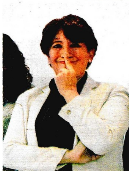
Delfina Gómez, candidata de Morena.