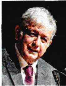
Andrés Manuel López Obrador