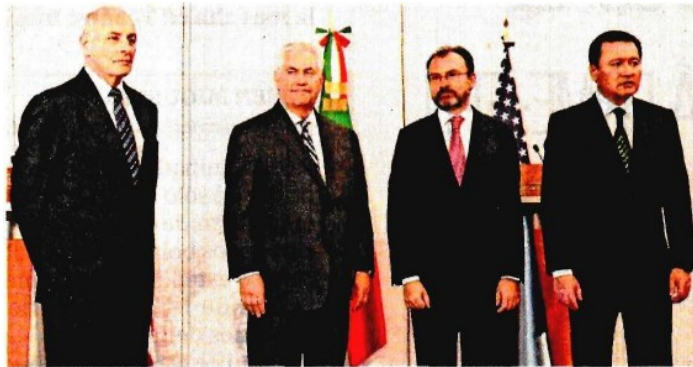
John Kelly, Rex Tillerson, Luis Videgaray y Miguel Osorio

Por enésima vez, la lengua del presidente Donald Trump metió en serios aprietos a la relación bilateral y en el momento de la reunión entre sus enviados, el jefe de la diplomacia Rex Tillerson y el secretario de Seguridad Nacional, John Kelly , con el canciller Luis Videgaray y el secretario de Gobernación, Miguel Ángel Osorio Chong . El jefe de la Casa Blanca dijo que las deportaciones de migrantes estaban en un ritmo nunca visto “y es una operación militar”. A partir de ese momento, las conversaciones se prolongaron y el tema migratorio se convirtió en toma y daca. Al finalizar, don John tuvo que hacer un triple esfuerzo para rechazar que los militares participaran en los procesos de deportación de indocumentados. Vaya, hasta llamó “hermanos y hermanas” a los mexicanos. ¿A quién le creemos?