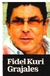
Fidel Kuri Grajales

Conforme se acercan las elecciones comienza a salir basura de un lado a otro; guerras de lodo le llaman algunos. Las más sobresalientes en los últimos días son las de Batres vs. Monreal y la de AMLO vs. Yunes . En el primer caso, el último episodio fue el de la grabación en donde el líder de Morena se refiere al delegado en Cuauhtémoc como “mafioso”. Y en el segundo caso están las acusaciones de corrupción entre el veracruzano y el tabasqueño. A ver quién sale menos sucio. ¿Será?