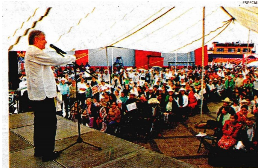
El líder de Morena estuvo de visita por Veracruz.