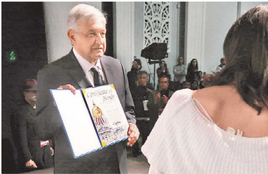
El dirigente de Morena.