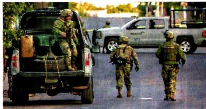
El Ejército ha pedido regular sus tareas de seguridad

Un buen debate se espera este miércoles en la tribuna del Senado. Nos comentan que a petición del senador panista Roberto Gil se realizará un debate abierto sobre la Ley de Seguridad Interior, que tanto han urgido a discutir y aprobar las Fuerzas Armadas. El cálculo de don Roberto es que en este debate aquellos legisladores que “nadan de muertito” en el tema asuman una posición, que los simuladores dejen de hacer como que hacen y que quienes consideren que las Fuerzas Armadas han cometido algún crimen que lo digan de manera abierta. El debate promete ponerse al rojo vivo en especial entre algunos senadores que tienen visiones diametralmente opuestas en el papel que deben desempeñar el Ejército y la Marina en tareas de seguridad interior.