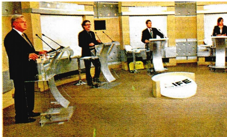
Debate de candidatos a la Presidencia de la República en 2012.