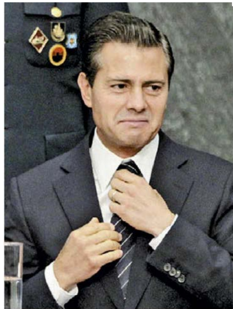
El presidente Enrique Peña Nieto.