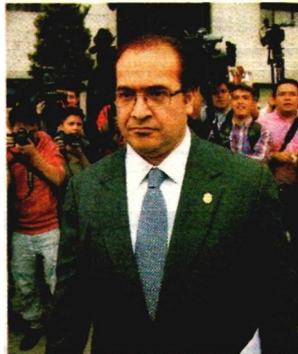
El ex gobernador de Veracruz.