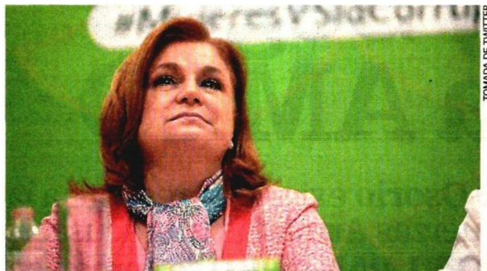
Arely Gómez, titular de la Secretaría de la Función Pública