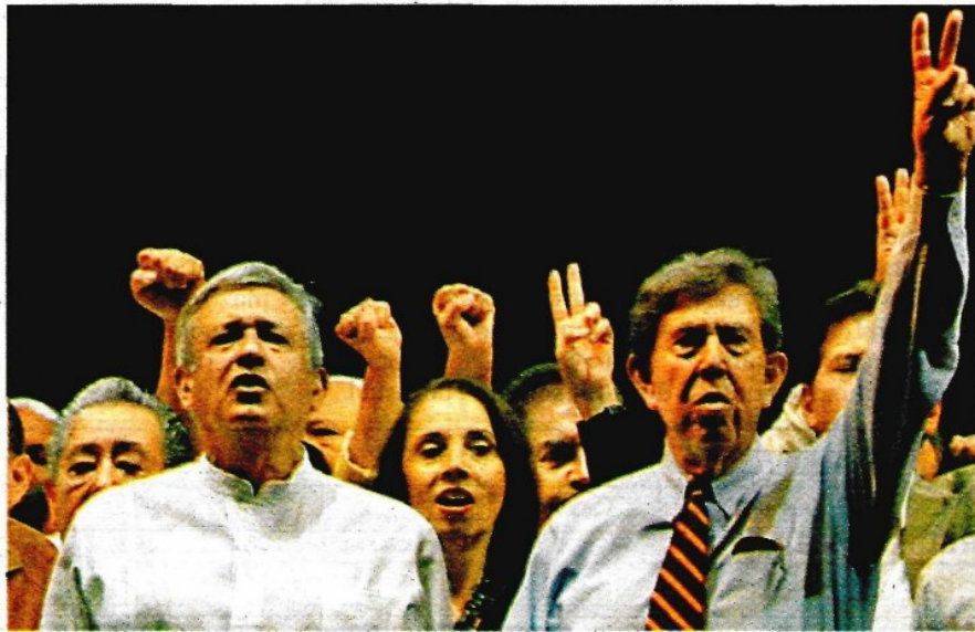
Andrés Manuel López Obrador y Cuauhtémoc Cárdenas.