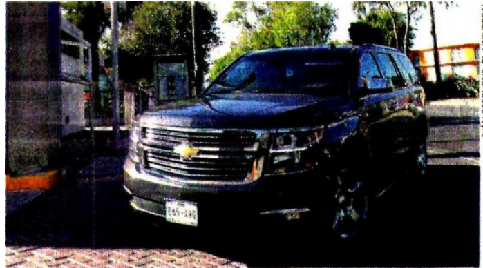
Una de las camionetas de los magistrados del TEPJF