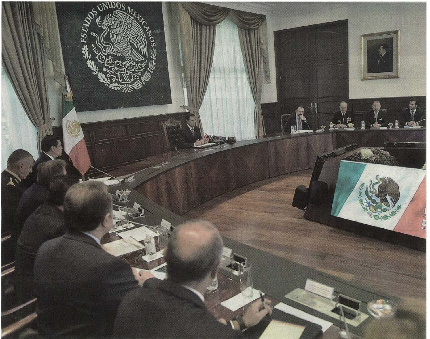
A pesar de la muralla, en torno a él, de un reducido equipo de colaboradores, no hay semana que no se filtre algo de lo que ocurre en lo más recóndito de su oficina