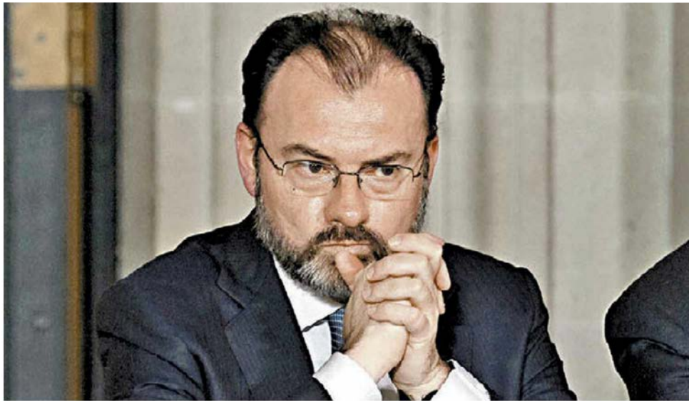
El secretario de Relaciones Exteriores.