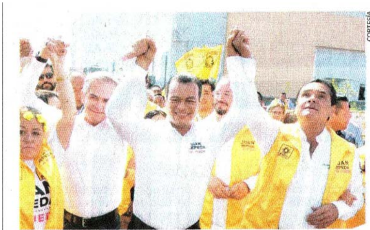
Miguel Ángel Mancera, Juan Zepeda y Silvano Aureoles