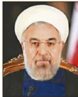
PRESIDENTE DE IRÁN