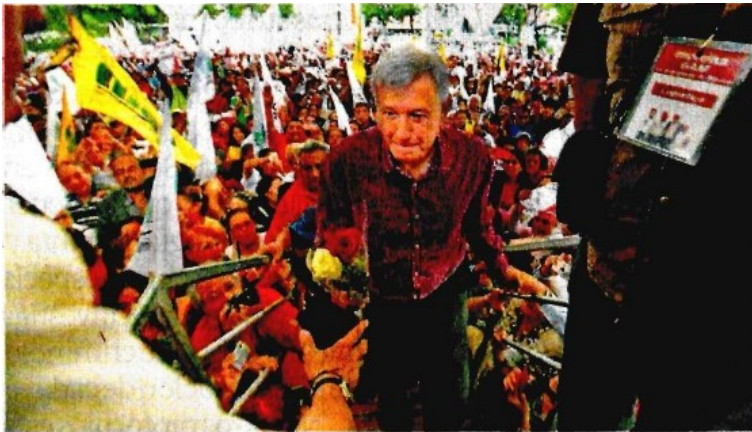
El presidente de Morena, Andrés Manuel López Obrador

Por demás reveladora resulta una encuesta de la Presidencia de la República sobre el proceso electoral de 2018, levantada del 6 al 8 de enero pasados, con una amplia muestra de 5 mil 275 entrevistados. Varios datos son interesantes, y a la pregunta: ¿por cuál partido votaría usted si hoy fueran las elecciones?, la mayoría de las personas, 20.73% de ellas, lo haría por el PAN, 16.77% por el PRI y 16.06% por Morena, partido encabezado por Andrés Manuel López Obrador , que está empatado técnicamente con el priísmo. Los resultados pues, arrojan una elección en tercios, con ventaja para el panismo. Pero el dato más relevante es el crecimiento de Morena y la caída acelerada del PRI. Las gráficas dan cuenta de que de julio de 2015 a enero de 2017 el PRI ha perdido casi 9 puntos, mientras que Morena ha crecido casi 8. Dado que el PAN y el PRD no han sufrido variaciones significativas, las gráficas muestran que muchos de los puntos que el PRI ha perdido se han ido a engordar la cuenta de Morena. En otras palabras, los priístas decepcionados o enojados están alimentando y haciendo crecer a Morena de don Andrés Manuel. ¡Caray!