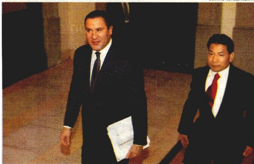
El gobernador de Puebla hipotecó el estado por 50 años, mediante ingeniería financiera engañosa.