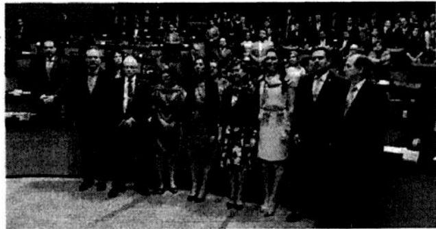
Toma de protesta de Paloma Merodio en la Cámara Alta