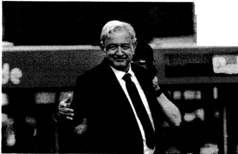
El líder nacional de Morena.