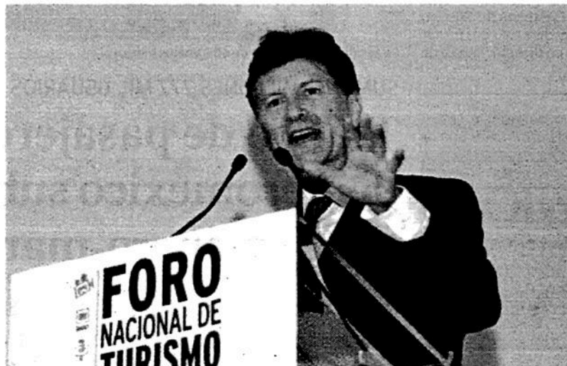
Con Enrique de la Madrid, Aeroméxico celebró diez años del vuelo CDMX-Buenos Aires.