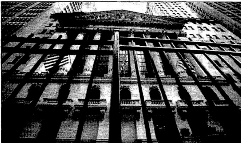
Una reja protege la fachada de la sede de la Bolsa de Valores de Nueva York. Los principales índices de Wall Street cerraron el jueves con una leve alza en una sesión volátil, porque los inversores esperan nerviosos el resultado de una reunión este viernes entre los presidentes de Estados Unidos y China, Donald Trump y Xi Jinping, respectivamente. El promedio industrial Dow Jones subió 0.07 por ciento, el índice ampliado Standard and Poor's (S&P) 500 ganó 0.19 por ciento y el compuesto tecnológico Nasdaq sumó 0.25 por ciento. La Bolsa Mexicana de Valores (BMV) terminó con una disminución de 0.4 por ciento en 49 mil 012.42 unidades

D.R. cfvmexico_sa@hotmail.com • Twitter: @cafevega