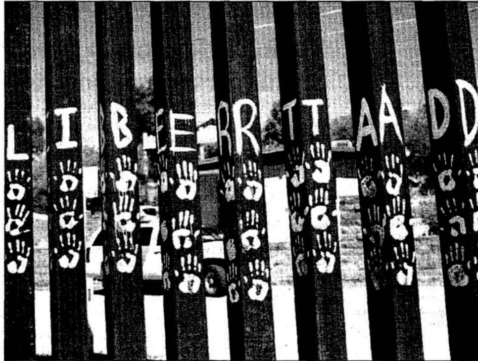
Desde que se dio a conocer que Nogales es uno de los puntos en los que el gobierno del estadounidense Donald Trump pretende dar inicio a la construcción de su muro, los habitantes han mostrado su rechazo. "Haremos cualquier cosa para evitar que la valla se edifique; las personas siempre encontrarán una forma de cruzar", han señalado en reiteradas ocasiones

Fax: 5605-2099 • juliohdz@jornada.com.mx • Twitter: @julioastillero • Facebook: Julio Hernández