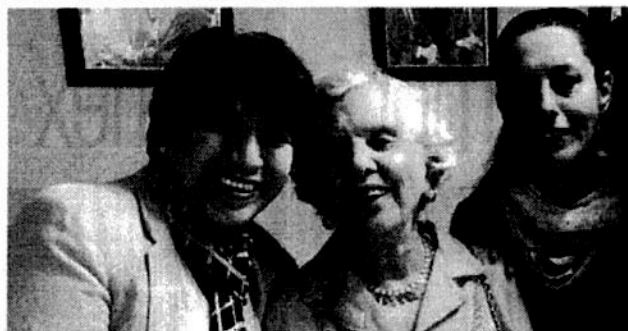
Delfina Gómez, Elena Poniatowska y Claudia Sheinbaum

Quién ganaría la gubernatura del Estado de México si las elecciones fueran hoy. A ciencia cierta nadie lo sabe. Lo que sí es un hecho es que la contienda está algo más que cerrada, según lo revela una encuesta encargada por la Presidencia de la República. De acuerdo con el estudio, realizado a partir de mil 500 entrevistas en 100 puntos de los distintos municipios de la entidad, y cuyo margen de error es de +/-4% y su confianza de 95%, no hay nada para nadie. La encuesta señala que Josefina Vázquez Mota , del PAN, tiene 23.98% de las preferencias; Alfredo del Mazo Maza , del PRI, 23.86%; Delfina Gómez Álvarez , de Morena, 21.37%. Y en un lejano, pero estratégico, tercer lugar, Juan Manuel Zepeda Hernández , del PRD, tiene 6.98%. La encuesta fue entregada el pasado 29 de marzo y son los números con los que el primer minuto de hoy arrancó la campaña electoral cuyos resultados, sin duda, tendrán una repercusión más allá de la gubernatura; sus efectos se harán sentir en los comicios federales de 2018.