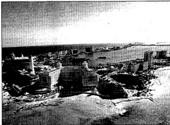
La empresa OHL recibió autorización de la Comisión Federal de Competencia Económica para vender hasta 80 por ciento de acciones de todos sus hoteles en Quintana Roo al grupo RLH Propiedades, que maneja en México hoteles de lujo, como Four Seasons y Mandarina, en la Riviera Nayarit. En la imagen, la zona turística de Cancún (Con información de Miriam Posada García)

D.R. cfvmexico_sa@hotmail.com • Twitter: @cafevega