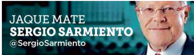
JAQUE MATE SERGIO SARMIENTO @SergioSarmiento

Los capitalinos no queremos la Carta Magna de la Ciudad de México, con la cual se busca mantener políticas del grupo en el poder.