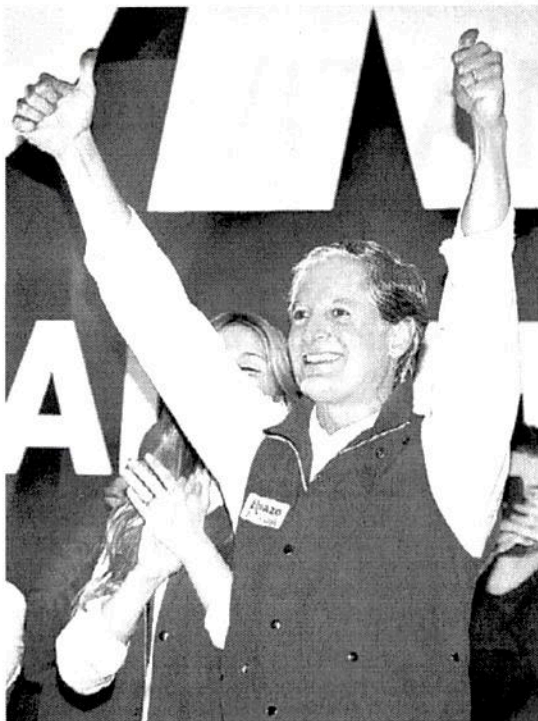
El aspirante tricolor hizo un llamado a la unidad.

AVANCE DE 76% DEL PREP La diferencia entre el priista y Gómez, de casi un punto porcentual