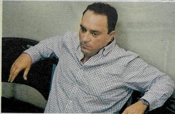
El mandatario estatal pretendía viajar a París, Francia.

Las órdenes de aprehensión tuvieron su origen por la venta de 24 inmuebles a un precio inferior