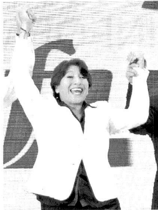
La texcocana también se declaró vencedora.

AVANCE DE 70% DEL PREP; DELFINA TAMBIÉN SE DECLARÓ VENCEDORA