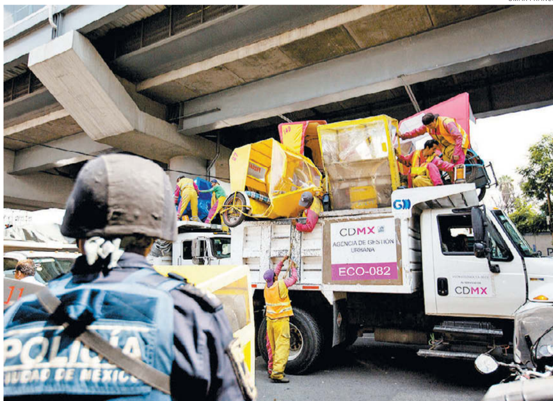
En operativo sorpresa, autoridades enviaron 87 mototaxis al corralón y aprehendieron a tres personas.

Trece casos en EU México ya investiga cuentas de venezolanos