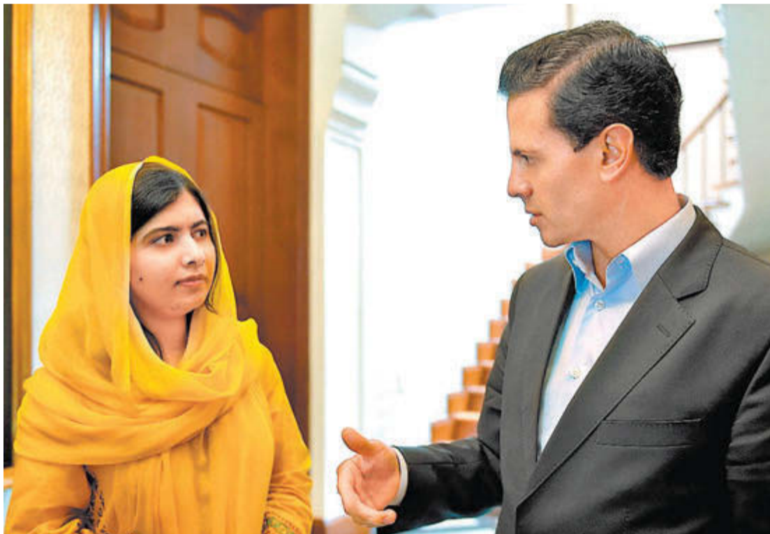
El titular del Ejecutivo recibió ayer en Los Pinos a Malala, Nobel de la Paz 2014, con quien se comprometió en su lucha a favor de las mujeres; más tarde, ante estudiantes, la paquistaní criticó la proyectada valla en la frontera.

Javier Duarte se echa una sopita, pero sigue en “huelga de hambre” P. 8