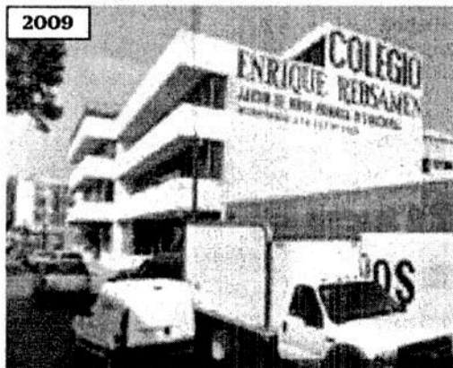
2009 EL UNIVERSAL comparó imágenes del colegio y en 2009 lucía sin el departamento del cuarto piso.