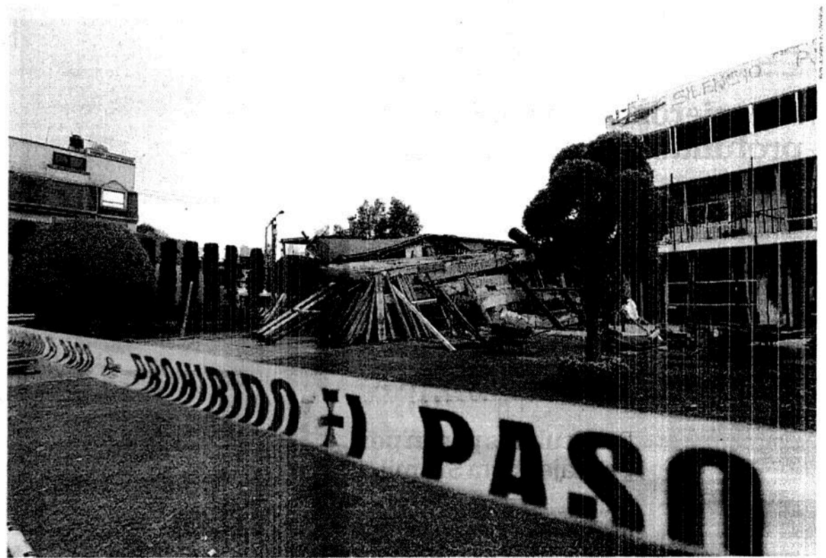
Uno de los edificios del Colegio Enrique Rébsamen se derrumbó el pasado 19 de septiembre y dejó un saldo de 27 personas fallecidas: 19 menores de edad y ocho adultos.