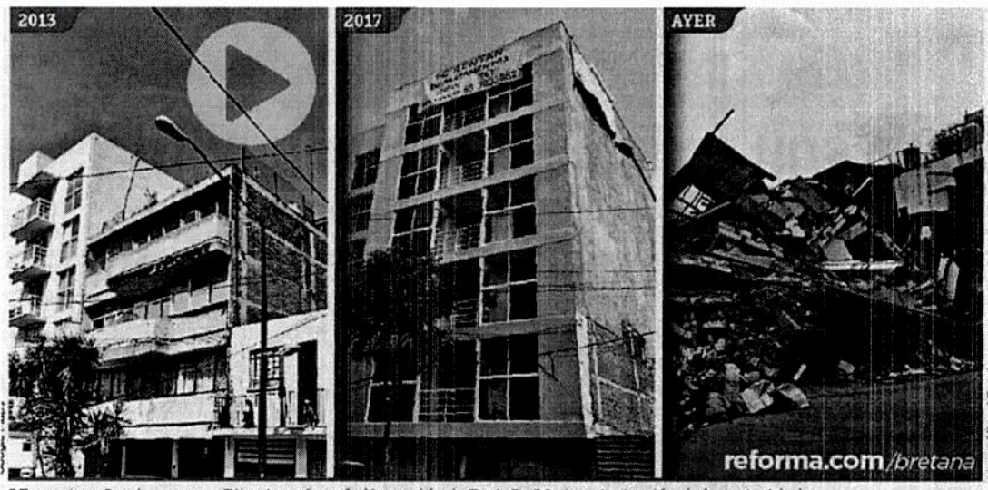
■ En cuatro años, la empresa Dijon transformó el inmueble de Bretaña 90 sin autorización de las autoridades.