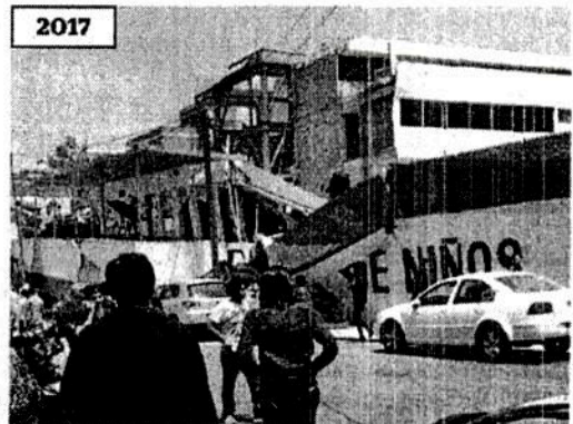
2017 Con el terremoto del 19 de septiembre el edificio colapsó; 27 personas murieron: 19 niños y 8 adultos.