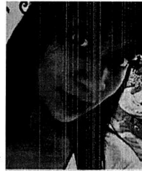
La joven llegó a la planta baja, pero ya no pudo salir.