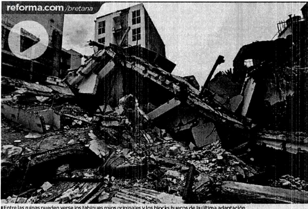
Entre las ruinas pueden verse los tabiques rojos originales y los blocks huecos de la última adaptación.

“La corrupción cuesta vidas, ahora este es el precio, hay una madre que ya no llegó a su casa y hay unos hijos, uno creo está de brazos, que ya no la tienen”.