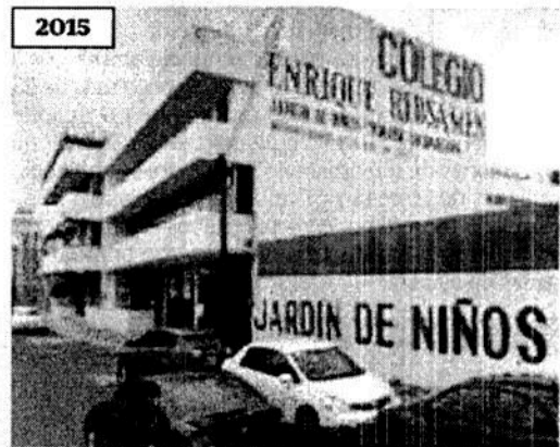
2015 En septiembre de 2015, la construcción en la parte superior del edificio se amplió hacia afuera.