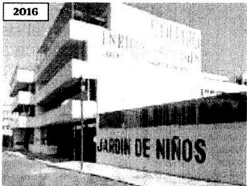
2016 Para diciembre de 2016, se podía observar una pérgola, de un departamento, cuya obra no fue verificada.