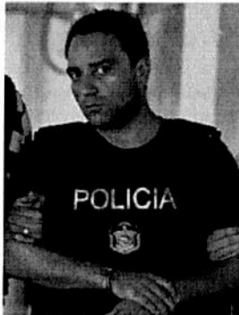
■ Roberto Borge está detenido actualmente en Panamá.