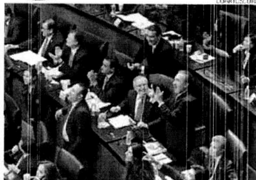
SIN CAMBIOS. Dan senadores luz verde a los Ingresos; falta ahora el Presupuesto, que discutirán los diputados.