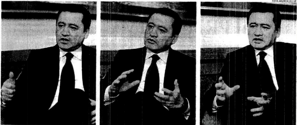
EL TITULAR de la Secretaría de Gobernación está confiado en que el Revolucionario Institucional dará batalla en la elección 2018

MIGUEL ÁNGEL OSORIO CHONG • SECRETARIO DE GOBERNACIÓN