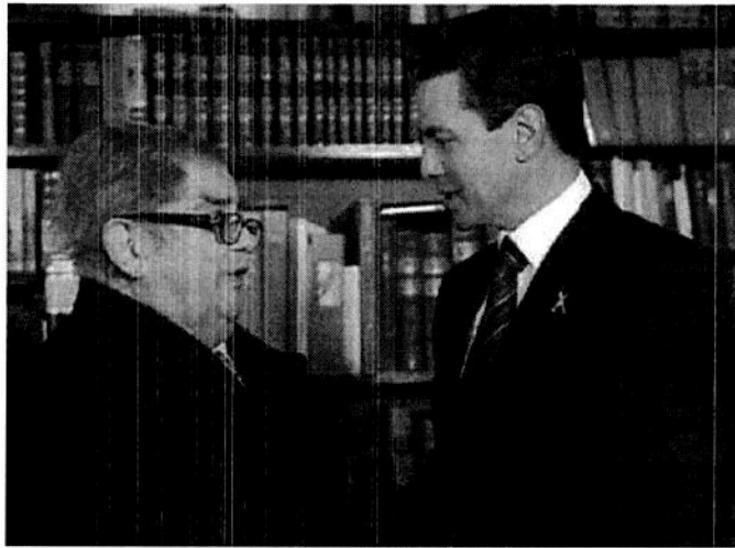
MIGUEL de León Portilla y el Presidente Enrique Peña, ayer.

EL FILÓSOFO se especializa en el pensamiento y la literatura náhuatl.