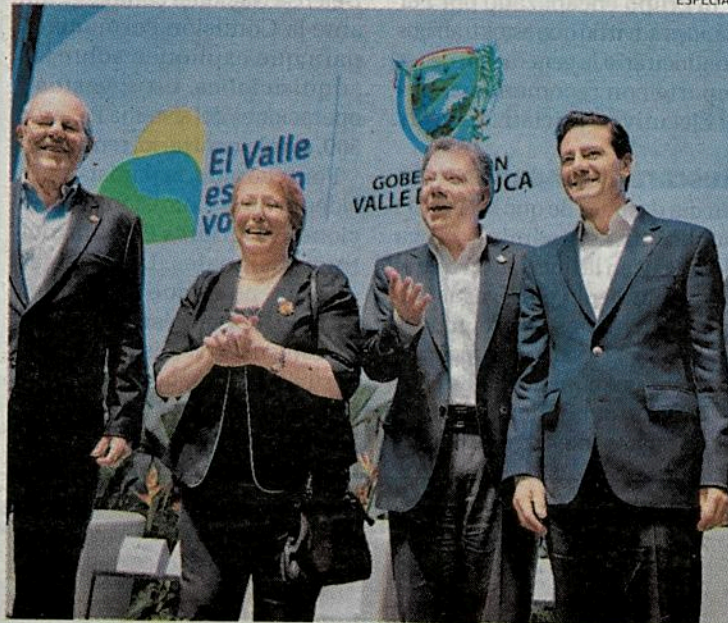
Los mandatarios de Perú, Chile, Colombia y México en la cumbre en Cali.

Resaltó que esta ampliación comenzará con otros países asociados en diferentes categorías, lo que refleja que la alianza está consolidada. Recordó que el organismo se creó para atraer mayor inversión, no comercio, porque