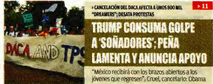
CANCELACIÓN DEL DACA AFECTA A UNOS 800 MIL "DREAMERS"; DESATA PROTESTAS

OSORIO PLANTEA UN FRENTE COMÚN GOBIERNO-SOCIEDAD CONTRA INSEGURIDAD