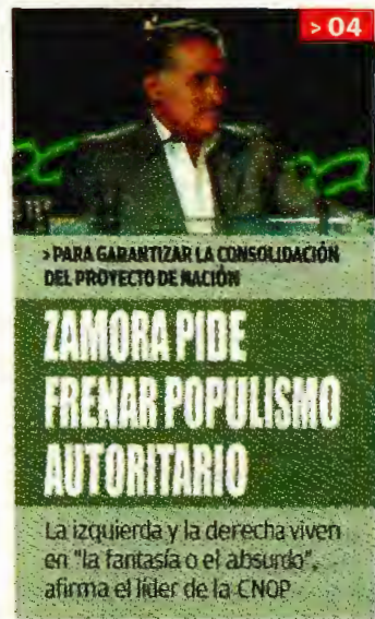
PARA GARANTIZAR LA CONSOLIDACIÓN DEL PROYECTO DE NACIÓN

ZAMORA PIDE FRENAR POPULISMO AUTORITARIO