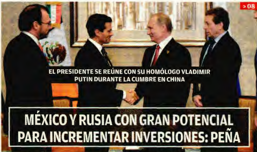
EL PRESIDENTE SE REÚNE CON SU HOMÓLOGO VLADIMIR PUTIN DURANTE LA CUMBRE EN CHINA

MÉXICO Y RUSIA CON GRAN POTENCIAL PARA INCREMENTAR INVERSIONES: PEÑA