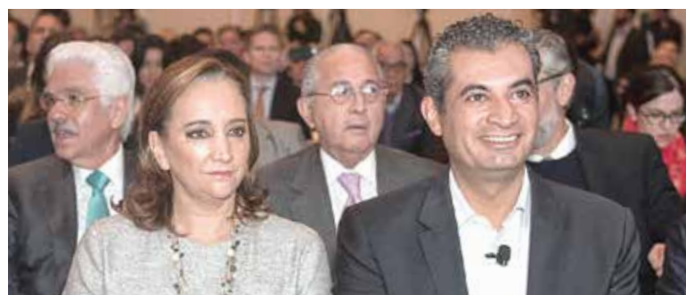
EN SUS MARCAS.... Claudia Ruiz y Enrique Ochoa firmaron la convocatoria.