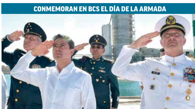
CONMEMORAN EN BCS EL DÍA DE LA ARMADA

"El PRI no habrá de elegir a su candidato a partir de elogios o aplausos"