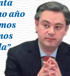
Aurelio Nuño EDUCACIÓN

“La pregunta del próximo año es si seguimos o caminamos a Venezuela”