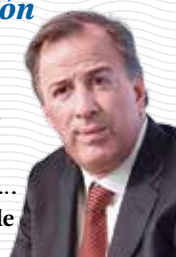
José Antonio Meade HACIENDA

“La negociación del TLC está en manos de mexicanos talentosos”