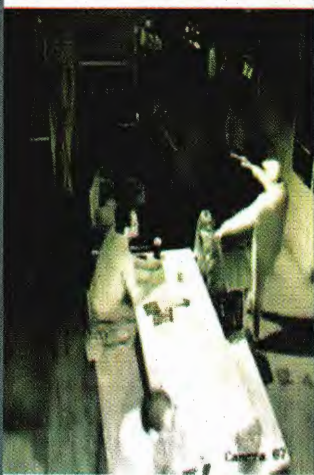
En una imagen de video se aprecia a un asaltante cuando amaga con su arma de fuego a comensales del Cine Tonalá.