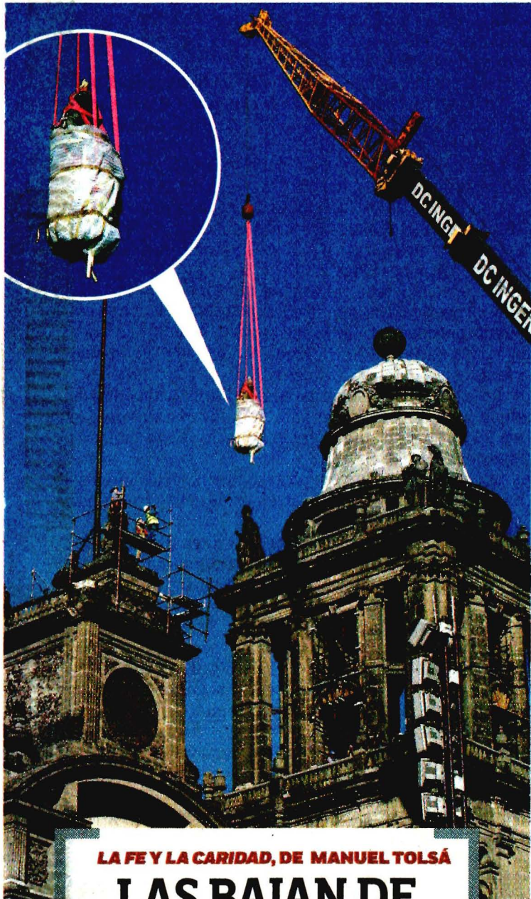
LA FE Y LA CARIDAD, DE MANUEL TOLSÁ

En el Pachuca, el Chucky Lozano estuvo a punto de ser dado de baja; hoy conquista a Holanda con goles.