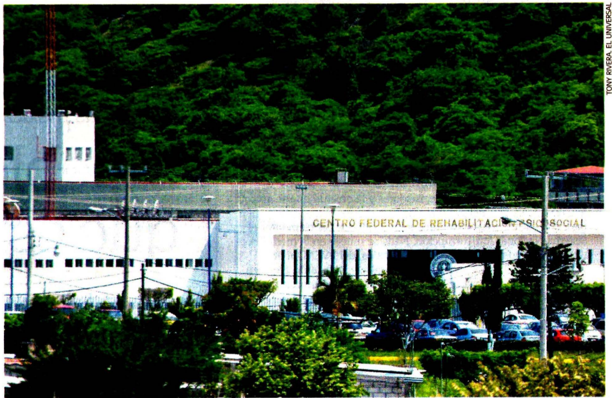
Ubicado en Ayala, Morelos, el Ceferepsi es el único penal en el país con internos que padecen desórdenes mentales.