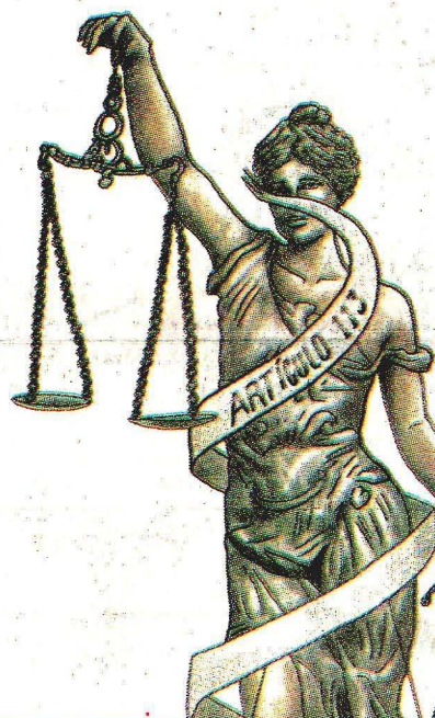
ILUSTRACIÓN: VÍCTOR NIETO Y ELIHU GALAVIZ