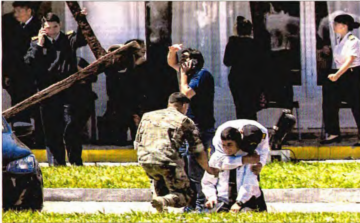
La noticia de la explosión en la zona donde desapareció el submarino llenó ayer de desolación la base de la Armada en Mar del Plata.