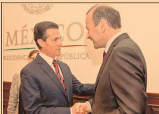
Enrique Peña Nieto se reunió con parlamentarios del Partido Popular Europeo.

El presidente de Estados Unidos, Donald Trump, fracasa en su intento por derogar el Obamacare. P45