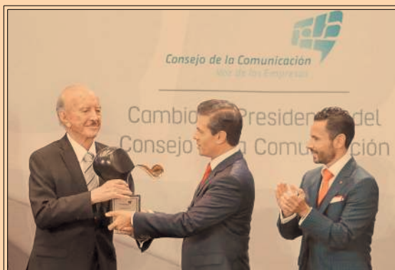
El presidente Peña Nieto encabezó la reunión del Consejo de la Comunicación en Los Pinos. P43

En el I trimestre del año, Megacable perdió 63,187 suscriptores y sus ingresos de video cayeron 4%. P29