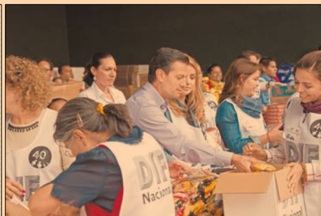
El presidente Peña Nieto y su esposa, en el armado de despensas. P40-41

24,000 servidores públicos se han desplazado a sitios dañados por el sismo.