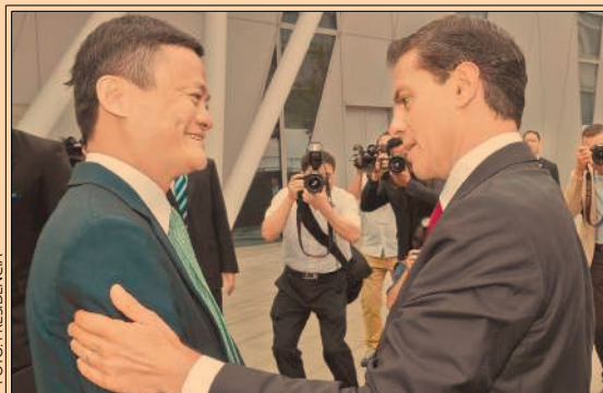
EPN y Jack Ma atestiguaron la firma de un acuerdo con Alibaba, para que pymes mexicanas suban sus productos a esa plataforma. P26

Se recuperaron $543 millones en combate al lavado de dinero, pero se invirtieron $614 millones. P10