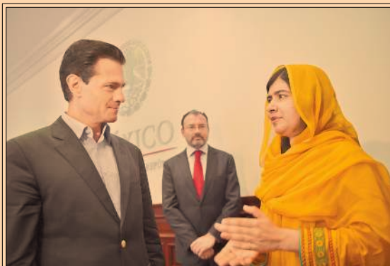
Peña Nieto habló de la reforma educativa con Malala, quien dio una conferencia en el Tec. P50

La SEP lanza convocatoria para inscribir a 646 profesores al programa de fortalecimiento del idioma inglés. P44