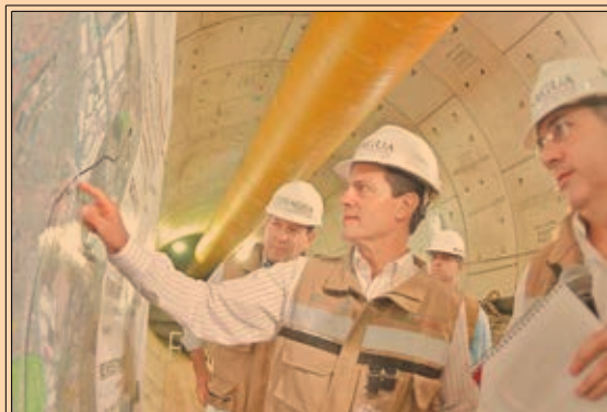
El presidente Peña Nieto supervisó las obras del Túnel Emisor Poniente II en el Edomex. P39

Insumos Immex crecieron 25.4% a tasa anual en las entidades federativas durante el I Trim del año. P34-35