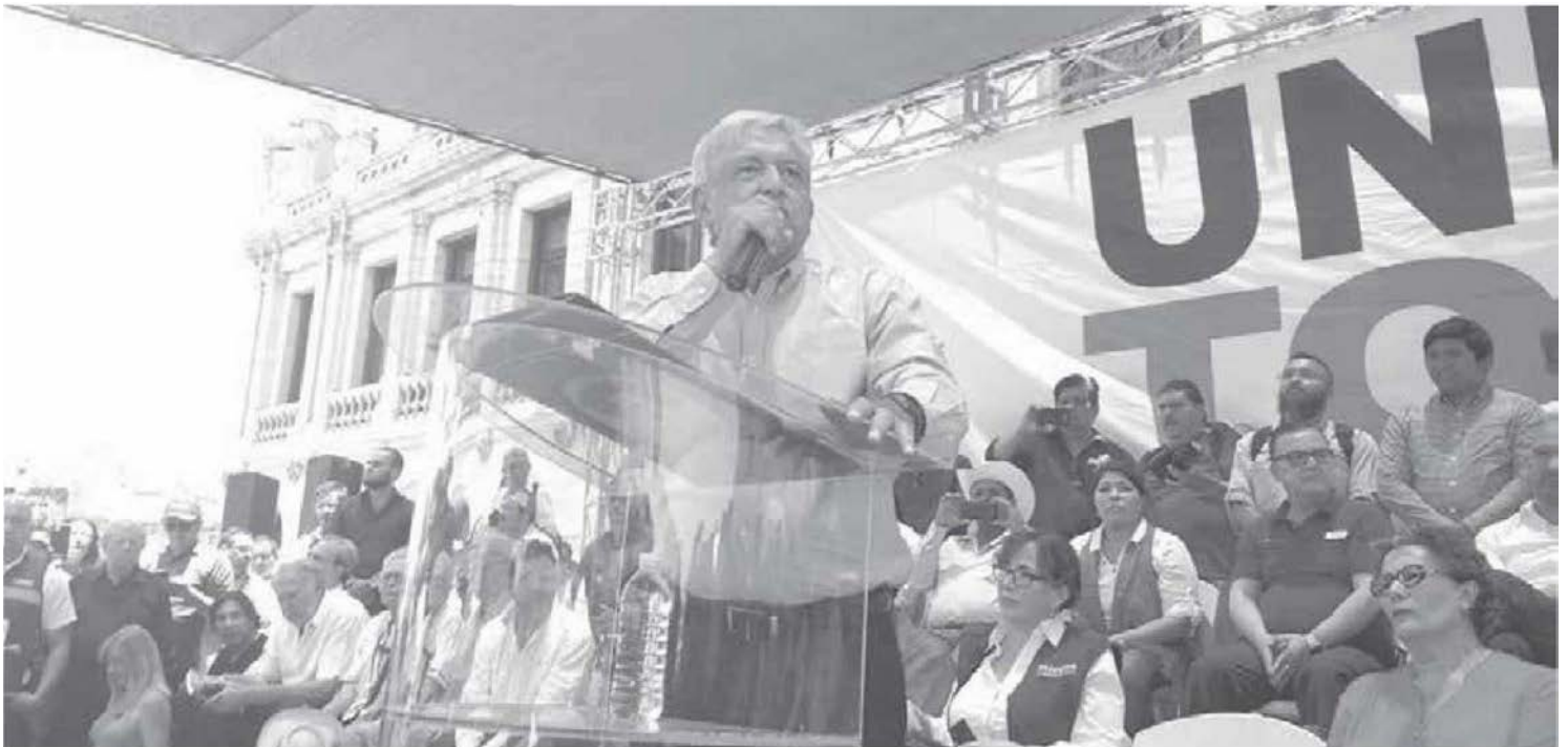
Andrés Manuel López Obrador obliga al PRI y al PAN a modificar las reglas del juego

Y que quede claro: Culpa no es de Meade, sino de los tiempos y de los priístas que desperdiciaron, miserablemente, los últimos cinco años en mantenerse en su partido y no construir prestigio.