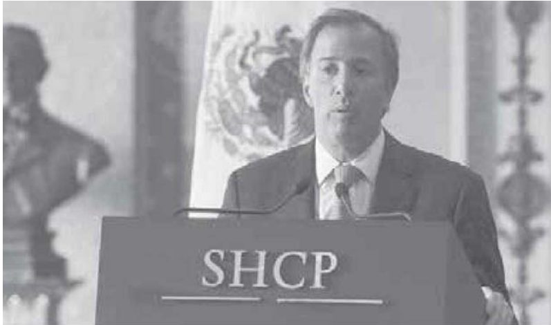
José Antonio Meade, Secretario de Hacienda, ¿el 'héroe simpatizante' con la fórmula anti-AMLO?