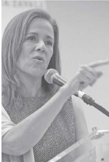
Margarita Zavala, obligada a irse por la ruta de los independientes