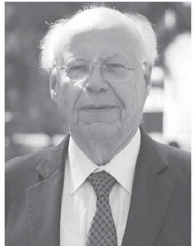
Miguel Osorio, Manlio Fabio Beltrones, Eruviel Ávila, Aurelio Nuño o José Narro... ¿Mínimo una disculpa?