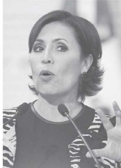
Rosario Robles, la 'simpatizante' ausente