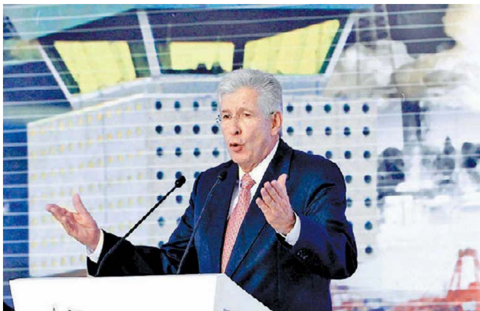
El secretario de Comunicaciones y Transportes, Gerardo Ruiz Esparza.