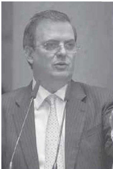
Marcelo Ebrard, por su parte, aterroriza al PRD