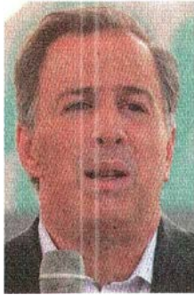
José Antonio Meade