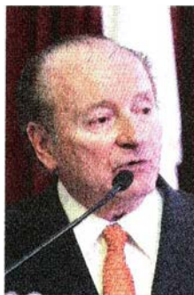
Robert C. Merton

Llegó el día esperado para el sector de telecomunicaciones en México. La Organización para la Cooperación y el Desarrollo Económicos (OCDE), encabezada por José Ángel Gurría , dirá este jueves si las recomendaciones que hizo en 2012 fueron consideradas en la reforma constitucional del sector y, lo más importante, si han dado resultados. Nos adelantan que la OCDE evalúa el impacto en el mercado, en el ámbito empresarial y en los hogares, y hace recomendaciones sobre medidas adicionales para que el sector aproveche estos avances. Llama la atención que el nuevo estudio es sobre telecomunicaciones y radiodifusión, pues anteriormente los análisis que realizó el organismo versaron nada más sobre el primer segmento, que incluye los servicios de telefonía fija y móvil, internet y televisión de paga. También genera expectativa lo que dirá el análisis sobre las empresas de Carlos Slím , pues en 2012 el empresario calificó como cifras "jaladas de los pelos" los datos dados a conocer por la OCDE, que mencionaba una pérdida de bienestar por la disfuncionalidad del sector de 129 mil 200 millones de dólares.